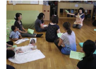
夏の過ごし方・冬の過ごし方