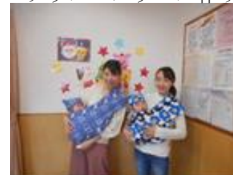
ベビースリング作り