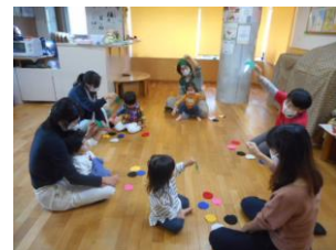
こあらっこ・こどもセンター