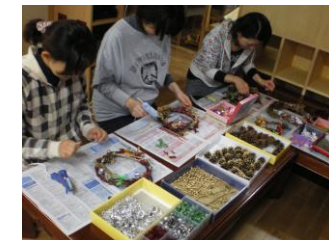
クリスマスリース作り