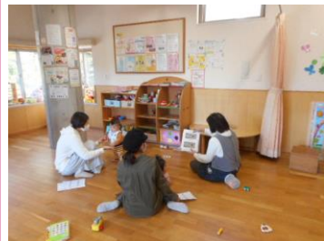
オープンスペース