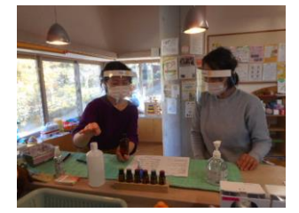
アロマでルームスプレー作り