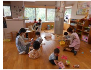
こあらっこ・こどもセンター