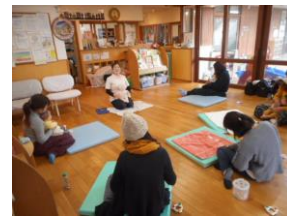
こあらっこ・こどもセンター