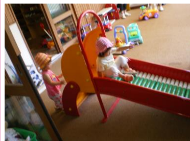
ローラースベリ台