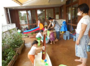
夏は中庭で水遊び