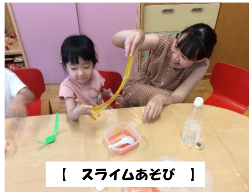
【 スライムあそび 】

暑さの厳しい日が続く中、家での遊びの工夫にと広場の中でスライム遊びをしました。スライムのドロツとした感触を子どもだけでなく、大人も「おもしろい」と楽しみました。「今日もスライムやりたい」と催促の声が聞かれるほど楽しかったようです。また、夏のごっこ遊びとして、広場の中に夏祭りコーナーを設けミニ夏祭りごっこも楽しみました。2～4歳の子どもには、かき氷屋さんが人気で、かき氷機で氷をかく真似をしたり、シロップをかける事が楽しいようでした。椅子に座り、買ったかき氷を友達と一緒に食べる真似をし「冷たい」「おいしい」などとニコニコ話していました。0～1歳児親子にはくじ引きが人気で、ママ達の方がお目当ての景品が当たるかどうか、ワクワクしながら楽しんでいました。