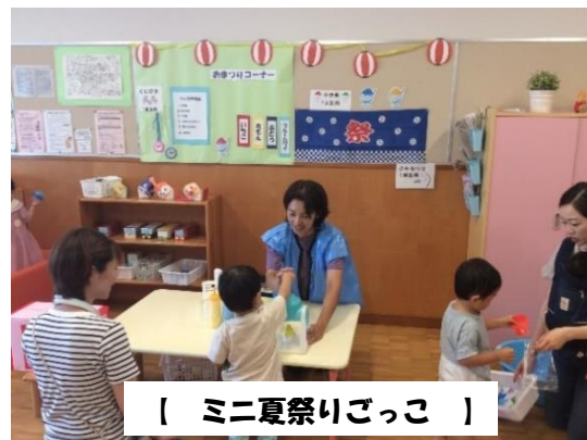
【 ミニ夏祭りごっこ 】