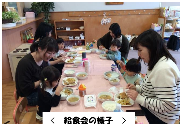
< 給食会の様子 >