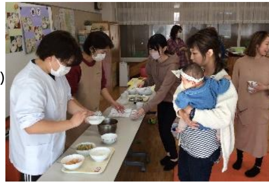
< 昨年の様子 >