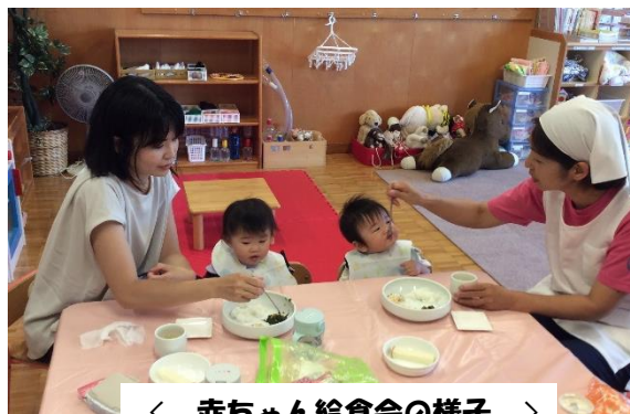
< 赤ちゃん給食会の様子 >