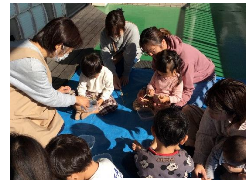
< 昨年の様子 >