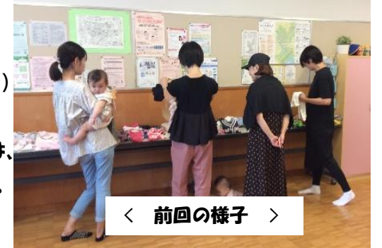
< 前回の様子 >

家で作る味付けが濃くなっている事に気付きました。家では作った事のない献立も参考になりました。